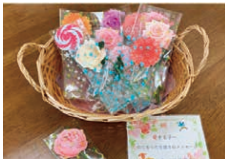
お花のレターセット