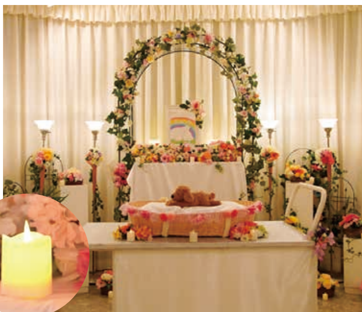
キャンドル葬 やわらかな光につつまれたお見送りを…

たくさんの仲間との最期の旅立ちに華をそえた、 ご家族さまのお気持ちをたいせつに考えたプランです。