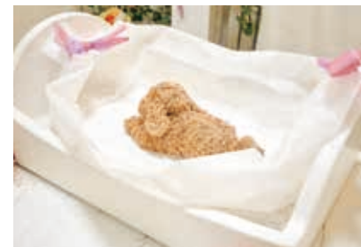
天使のひつぎ (キャンディコフィン) 焼却灰がほとんどでない、 環境に配慮したひつぎです。